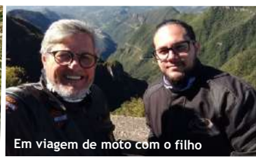
Em viagem de moto com o filho

Quer participar da seção Por onde anda? Mande um e-mail para previg@previg.org.br