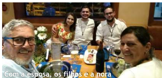
Com a esposa, os filhos e a nora