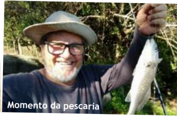
Momento da pescaria