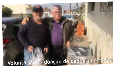
Voluntariado - doação de cadeira de rodas

“A PREVIG dá uma estabilidade melhor para mim e minha família após a aposentadoria”