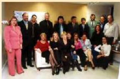
SÓ SORRISOS: Equipe PREVIG no dia da inauguração da sede