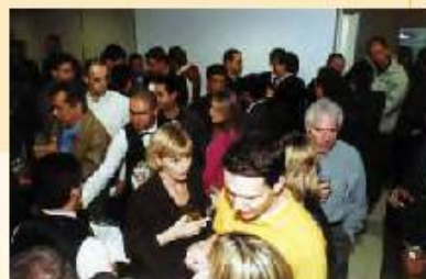
ENCONTRO SAUDÁVEL: As salas da nova sede abrigaram mais de 100 pessoas que foram conhecer o espaço da PREVIG