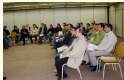
PREVIG recebendo 54 novos colaboradores da Tractebel Energia

Quem está preocupado com a sua aposentadoria? Esta pergunta foi feita aos 54 novos colaboradores da Tractebel Energia, a maioria jovens em início de carreira, num evento realizado na FIESC, em 2 de agosto. A pergunta parece um tanto paradoxal, já que foi feita a um grupo de jovens. Mas é bom lembrar que para construir uma boa poupança previdenciária o fator tempo é imprescindível. O quanto antes começar, melhor. Portanto, desde agora reserve um tempo para você efetuar o seu planejamento para uma aposentadoria mais digna.