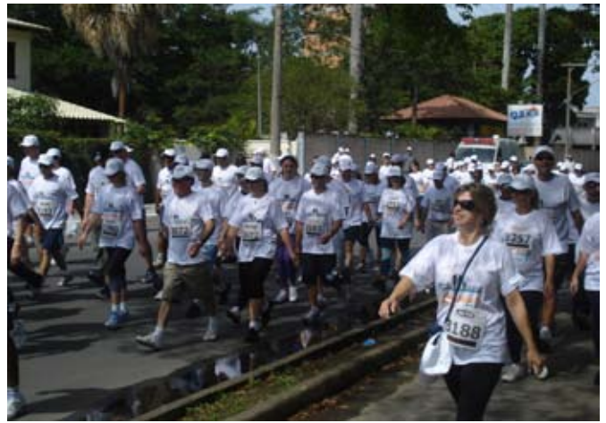
Cerca de 160 pessoas se inscreveram para a 5ª Caminhada da PREVIG, realizada no Dia das Crianças, na cidade de Tubarão

Para alegria geral, o domingo amanheceu com céu azul e muito sol. E às 9h30, como combinado, foi dada a largada para o trajeto de 4,7 km. Entre os 160 inscritos, estavam os Caminhantes Oficiais - apelido dado ao grupo que todos os anos sai de Itá (SC), es-