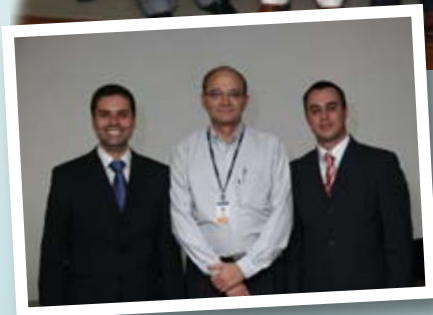
Comitê de Investimentos