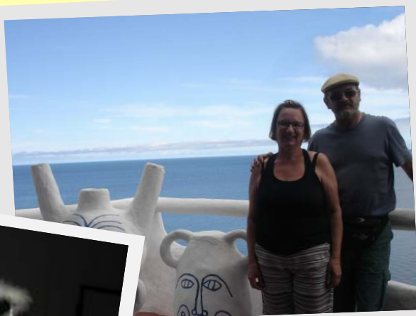
Punta Del Este