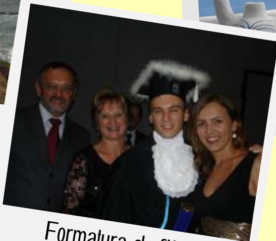
Formatura do filho