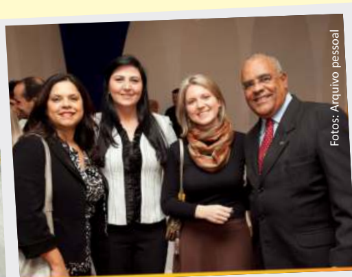
Candidatura para conselheiro da OAB/SC