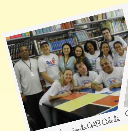
Encontro da equipe da OAB Cidadã

Nos momentos de lazer o aposentado gosta de estar com a família e cercado pelos amigos. Sempre que possível mantém contato com ex-colegas, ele participa periodicamente de encontros com o grupo. “Nesses 37 anos que estou em Florianópolis conquistei muitos amigos e sempre que posso gosto de confraternizar em um local agradável para colocarmos a conversa em dia. Acampar é a minha paixão então aproveito esses momentos de lazer para curtir a família e os amigos”, comenta. Há 16 anos, todo o verão, ele acampa na Sede Balneária da OAB/SC.