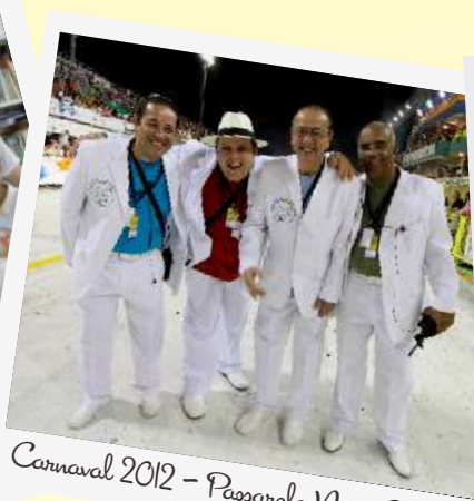
Carnaval 2012 - Passarela Negro Quirido