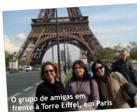
O grupo de amigas em frente à Torre Eiffel, em Paris

“Desde que comecei a trabalhar já iniciei meu planejamento financeiro, pois queria ter essa tranquilidade que tenho agora para desfrutar da aposentadoria. Hoje tenho certeza que fiz a coisa certa, vejo que a previdência complementar faz toda a diferença”