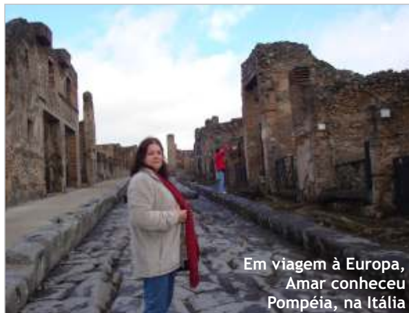
Em viagem à Europa, Amar conheceu Pompéia, na Itália