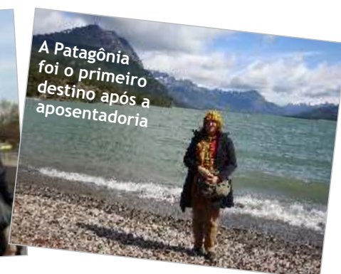
A Patagônia foi o primeiro destino após a aposentadoria

Quer participar da seção Por onde anda? Mande um e-mail para previg@previg.org.br