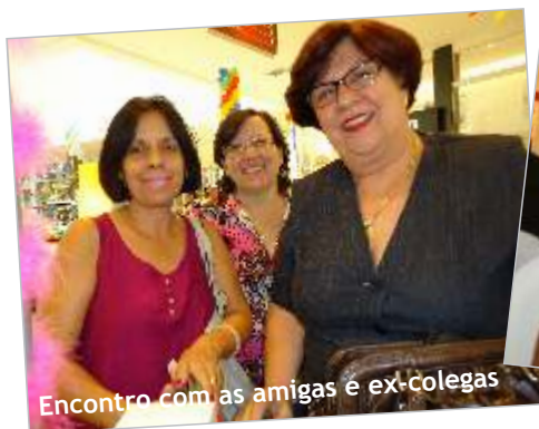
Encontro com as amigas e ex-colegas